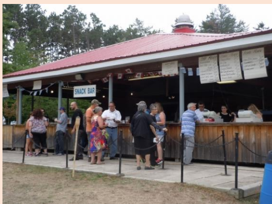
Φωτογραφίες από το θερινό πανηγύρι

Παράδειγμα προς μίμηση για πολλούς ομογενειακούς συλλόγους αποτελεί η αδελφότητα στο Τορόντο το Καναδά. Όπως έχουμε αναφέρει και σε προηγούμενα τεύχη, αποτελεί ένα ζωντανό Σύλλογο με αρκετές δραστηριότητες που κρατά ζωντανές τις μνήμες του χωριού μας στους Καρυάτες που έχουν μεταναστεύσει στην όμορφη χώρα του Καναδά. Οι δραστηριότητες ξεκινούν με το άνοιγμα του ιδιόκτητου πάρκου «ΚΑΡΥΕΣ» τον Μάιο για να ακολουθήσει το θερινό διήμερο πανηγύρι.