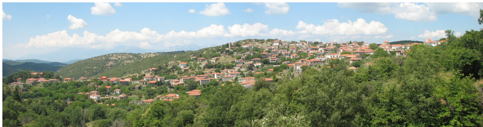
Άποψη των Καρυών από το δρόμο του Αγίου Κωνσταντίνου