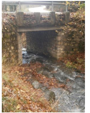
Η γέφυρα στο Αϊδονόρεμα

Ενημερωτικό Δελτίο του Συνδέσμου των Απανταχού Καρυατών